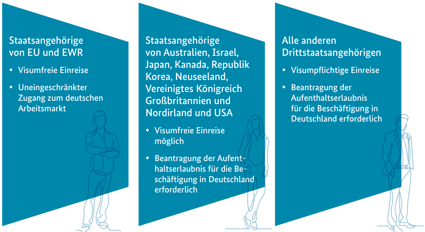
Abbildung 1: Zugang zum Arbeitsmarkt - Wer braucht ein Visum?

Die Bundesrepublik Deutschland hat, was die Einreise und den Zuzug von Fachkräften betrifft, mit einigen Staaten besondere Abkommen, die eine visumfreie Einreise ermöglichen. Für alle anderen gelten je nach Einreisezweck unterschiedliche Visaregelungen.